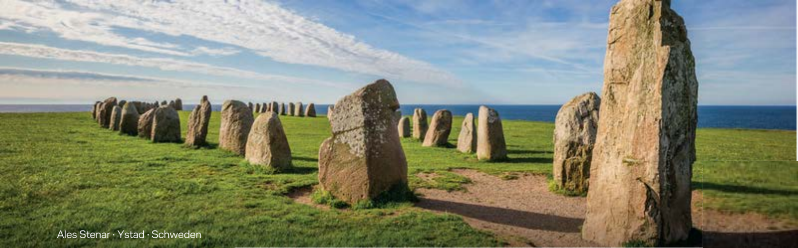
Ales Stenar · Ystad · Schweden