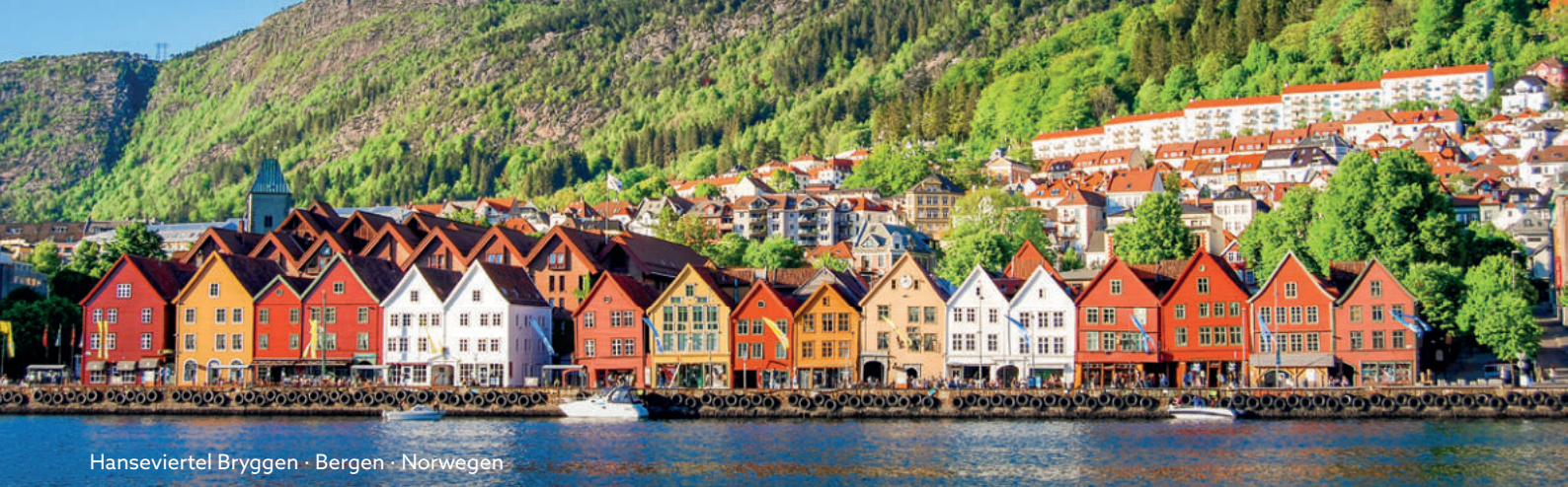
Hanseviertel Bryggen · Bergen · Norwegen