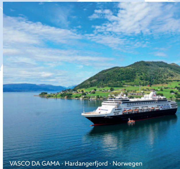
VASCO DA GAMA · Hardangerfjord · Norwegen