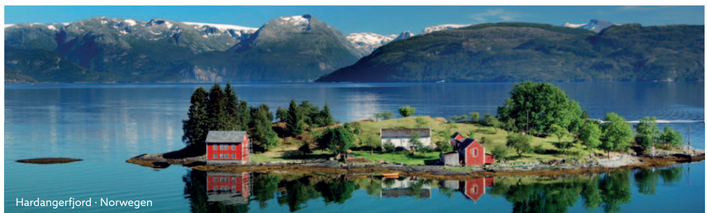
Hardangerfjord · Norwegen